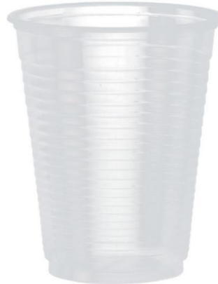
Ilustrações do produto