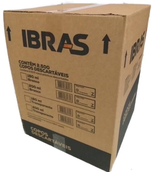
Ilustrações da caixa