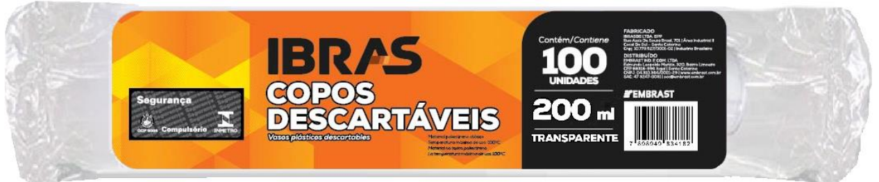
Ilustrações do pacote